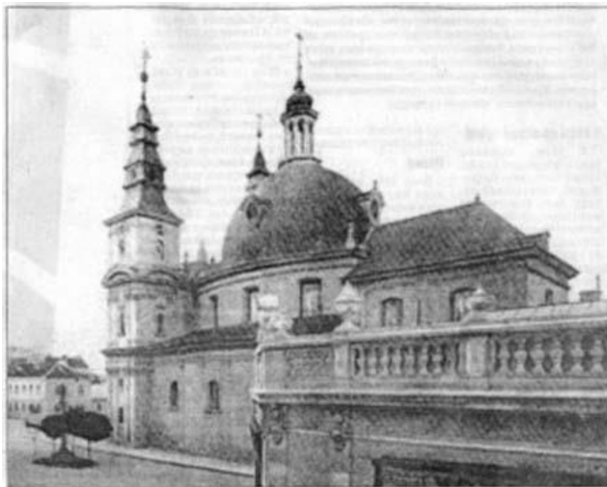
Рис.1. Домініканський собор та монастир. Поч. XX ст.

Із початком Першої світової війни. 23 серпня 1914 року в Тернопіль зайшла російська армія. Солдати обстріляли фасад костелу, пошкодили фігури святих на фронтоні, знищили вівтар Богородиці, грабували крамниці та склади, у монастирі влаштували конюшні, викрали дзвони та цінні речі з костелу. Відступаючи, у 1917 році російські солдати під керівництвом офіцерів підпалили та пограбували місто[6].